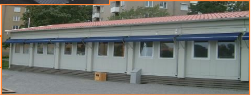
Sadeltak & markiser