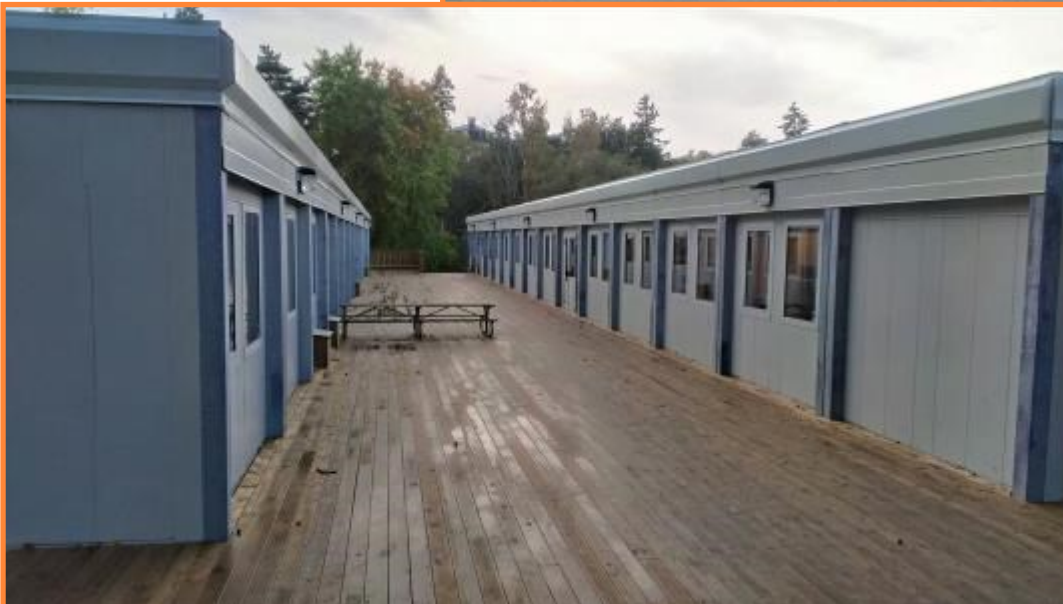
Trädäck Trappa Ramp