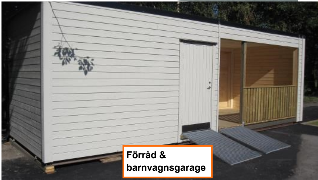
Förråd & barnvagnsgarage