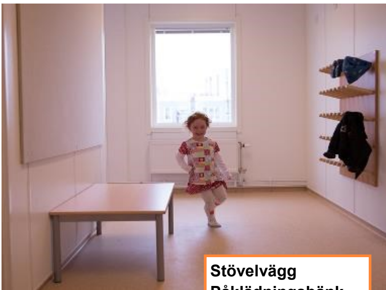
Stövelvägg Påklädningsbänk Anslagstavla Kapprumsinredning