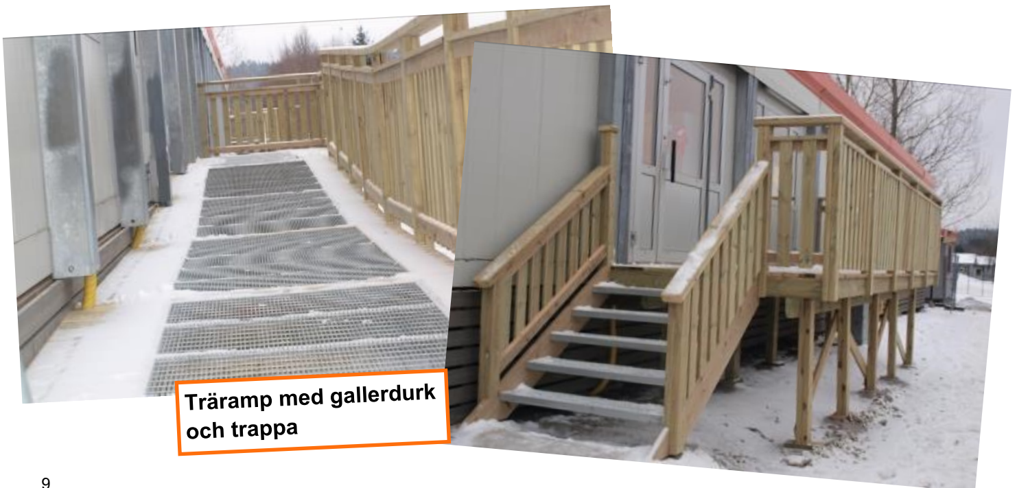
Träramp med gallerdurk och trappa