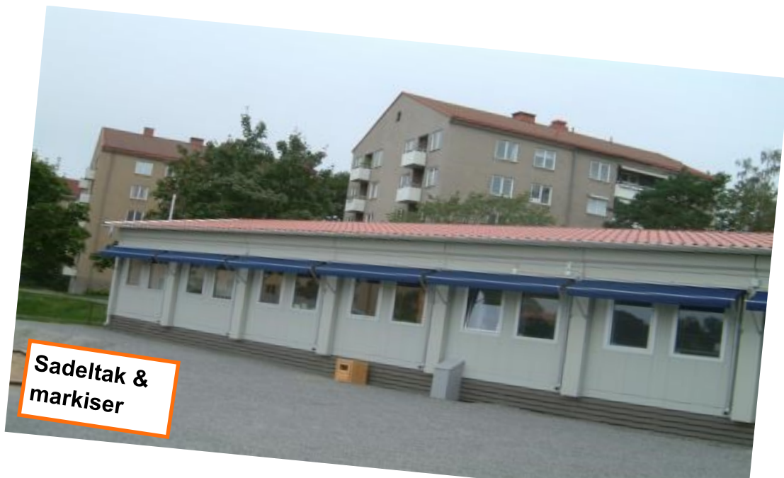
Sadeltak & markiser