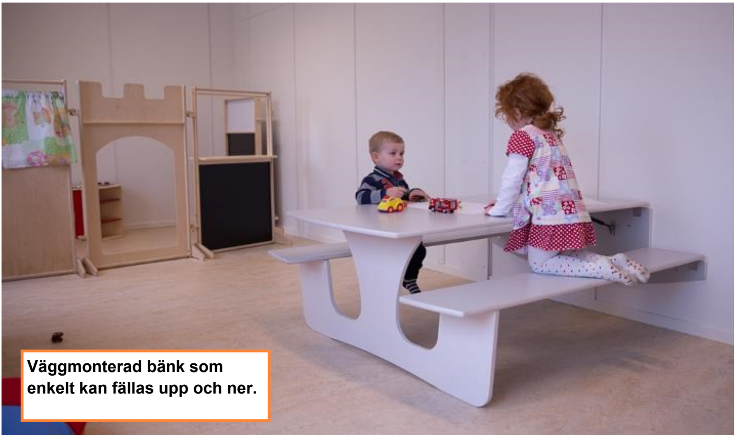
Väggmonterad bänk som enkelt kan fällas upp och ner.