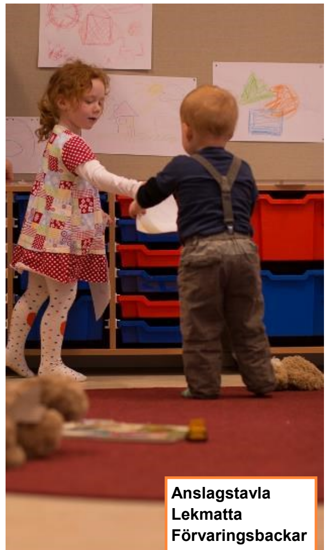
Anslagstavla Lekmatta Förvaringsbackar